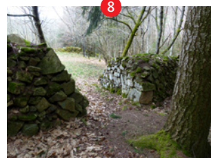
Site de la Truche

• A l'étang de Fontbonne, parcourez le sentier « entre ruisseau et forêt » d'environ 2 km, vous ferez la transition entre la zone humide et le milieu sylvicole.