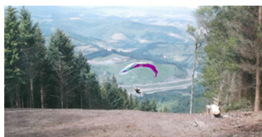
Piste de parapente