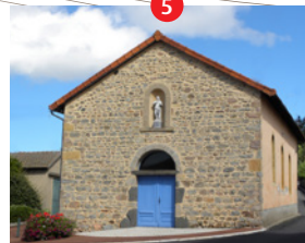
Chapelle Saint Roch