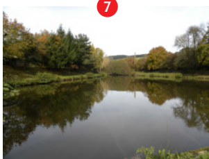
Etang de Fontbonne